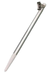
ユーソニックミニ 杭設置台 USONIC-mini-PKT オープン価格

※商品は販売代理店を通してのお見積り、販売させていただいております。 取扱い代理店がご不明な場合は、別途ご紹介させていただきますので、当社までお問い合わせください。