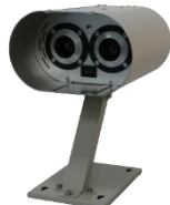
ユーソニックミニ 標準設置台付 USONIC-mini-B1 オープン価格