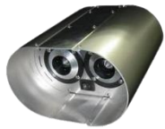
ユーソニックミニ 本体 USONIC-mini-B0 オープン価格