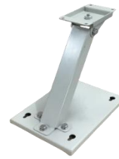
ユーソニックミニ 標準設置台 USONIC-mini-STD オープン価格